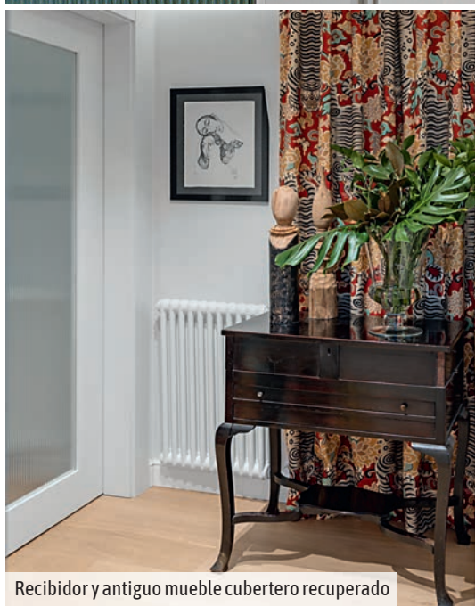
Recibidor y antiguo mueble cubertero recuperado

Como es habitual en los proyectos del estudio, la iluminación juega un papel muy importante. En el caso de los baños, para generar una atmósfera relajante y agradable siempre apuestan por la luz indirecta en duchas y luz directa en lavabos. Destaca el aplique "Funnel" de Vibia.