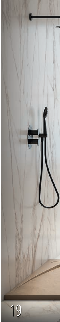
18. “Olympia” incorpora el sistema de fijación a la pared Decofix, que soporta cargas superiores a los 240 kg. Además de las opciones en catálogo, aceptan encargos a medida. De DECOSAN. www.decosan.com