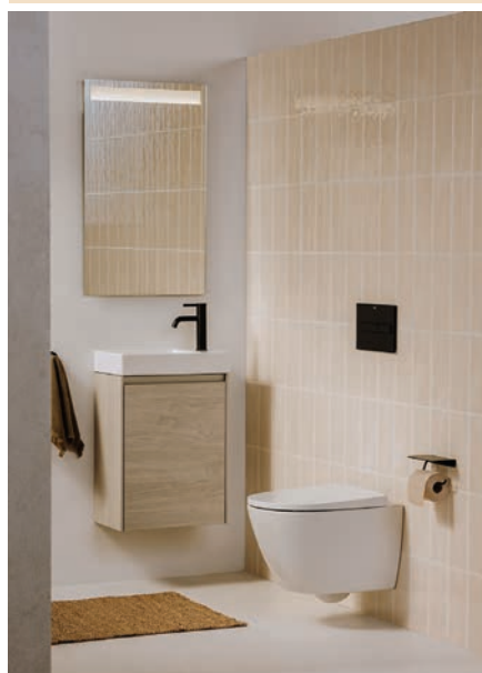
"Ona" de ROCA. www.roca.es

"Fusion" de ARTELINIA. https://www.artelinea.it