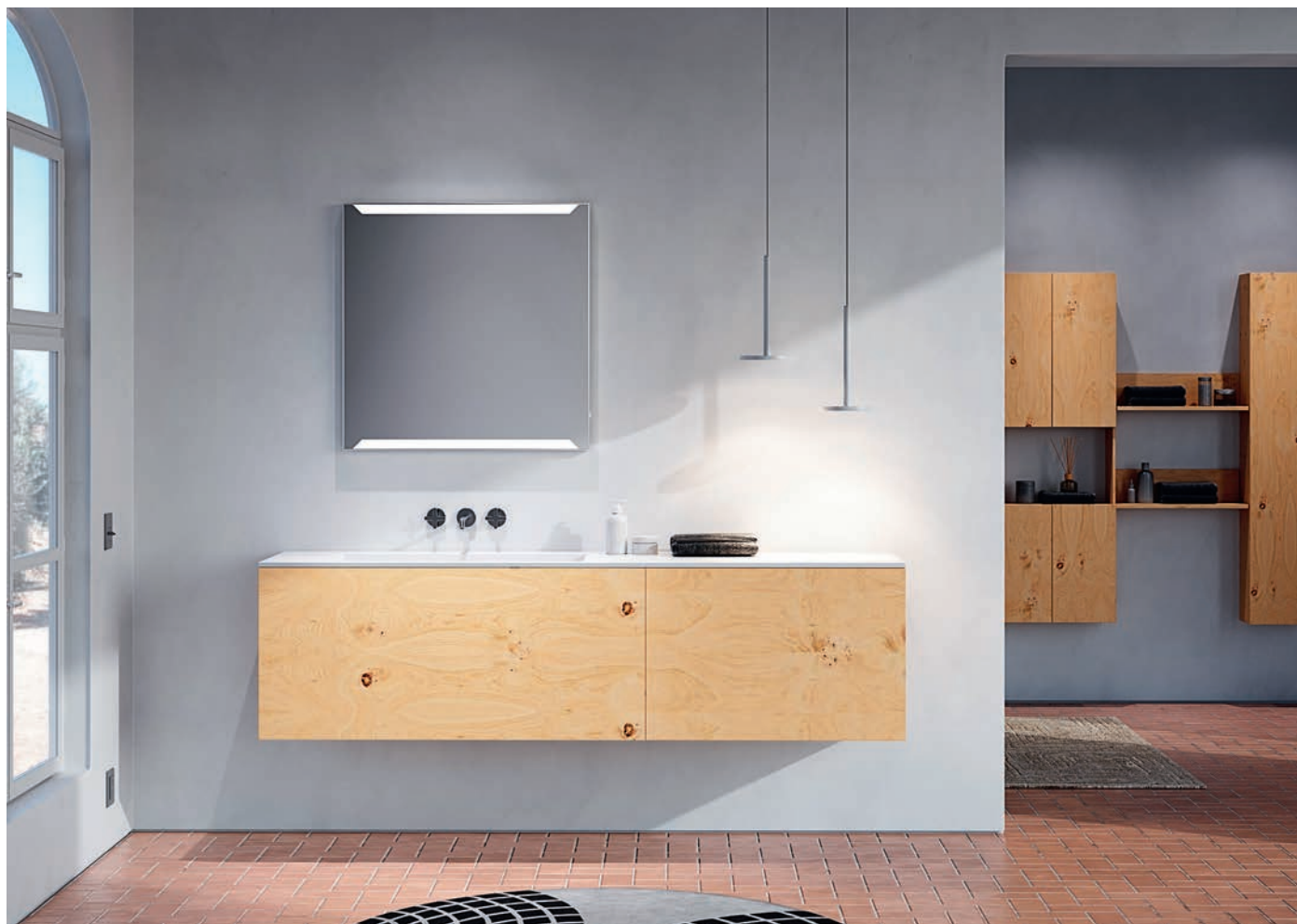
Mueble suspendido de DECOSAN. www.decosan.com