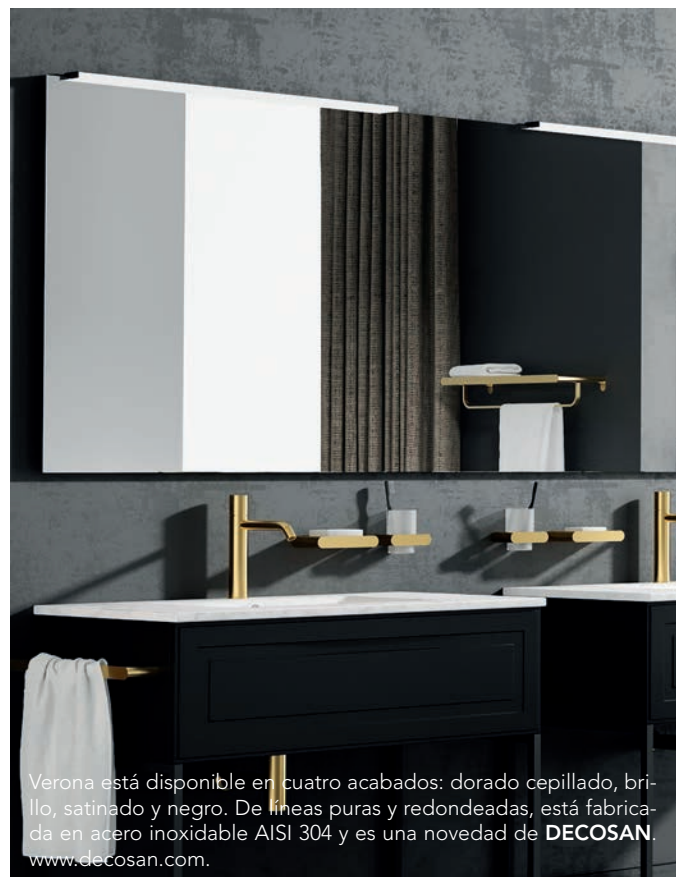
Verona está disponible en cuatro acabados: dorado cepillado, brillo, satinado y negro. De líneas puras y redondeadas, está fabricada en acero inoxidable AISI 304 y es una novedad de DECOSAN . www.decosan.com .