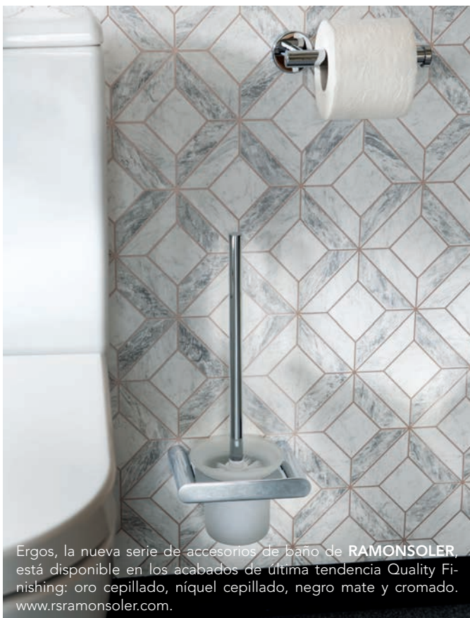
Ergos, la nueva serie de accesorios de baño de RAMONSOLER , está disponible en los acabados de última tendencia Quality Finishing: oro cepillado, níquel cepillado, negro mate y cromado. www.rsrmonsoler.com .