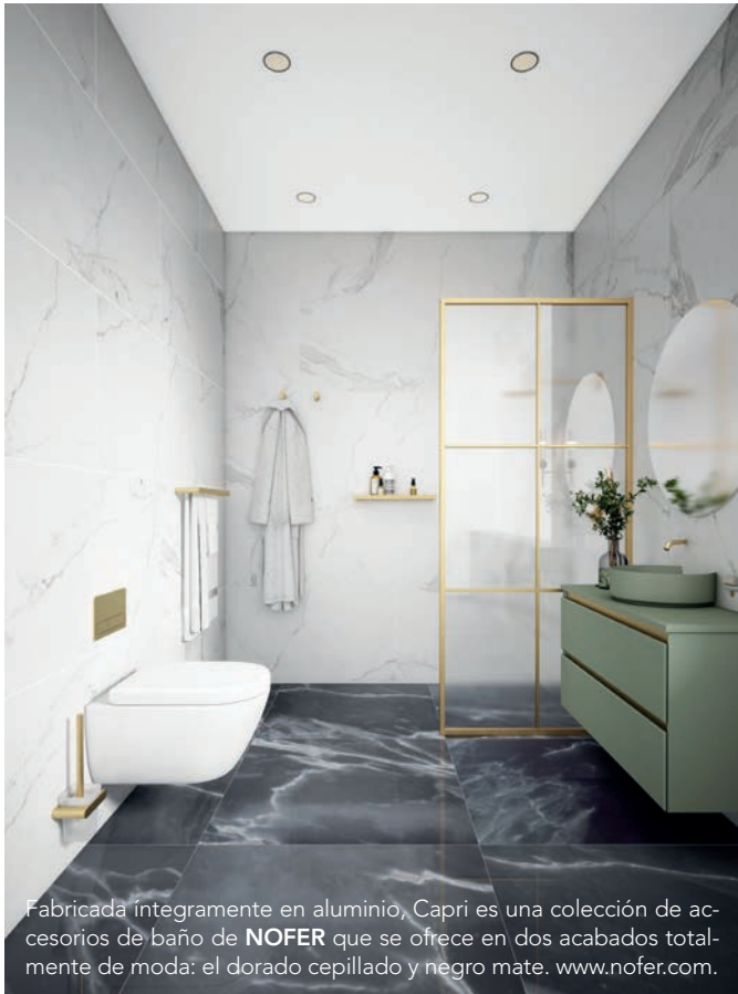
Fabricada íntegramente en aluminio, Capri es una colección de accesorios de baño de NOFER que se ofrece en dos acabados totalmente de moda: el dorado cepillado y negro mate. www.nofer.com .