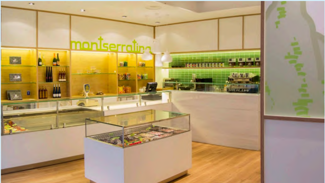
Nueva pastelería Montserratina.

Así, hay una zona de neveras para la exposición de pastelería, una barra de cafetería, un módulo central destinado a la bombonería y pastas de té, un práctico y coqueto WC y finalmente, junto a la entrada, la zona de mesas para degustar.