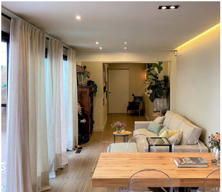
Antes y después del salón.

adornos, entre los cuales destacan cuadros originales del pintor Jordi Alamá o dos figuras antiguas muy singulares de latón esmaltado de Azul Tierra.