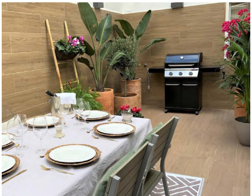
Antes y después del patio.