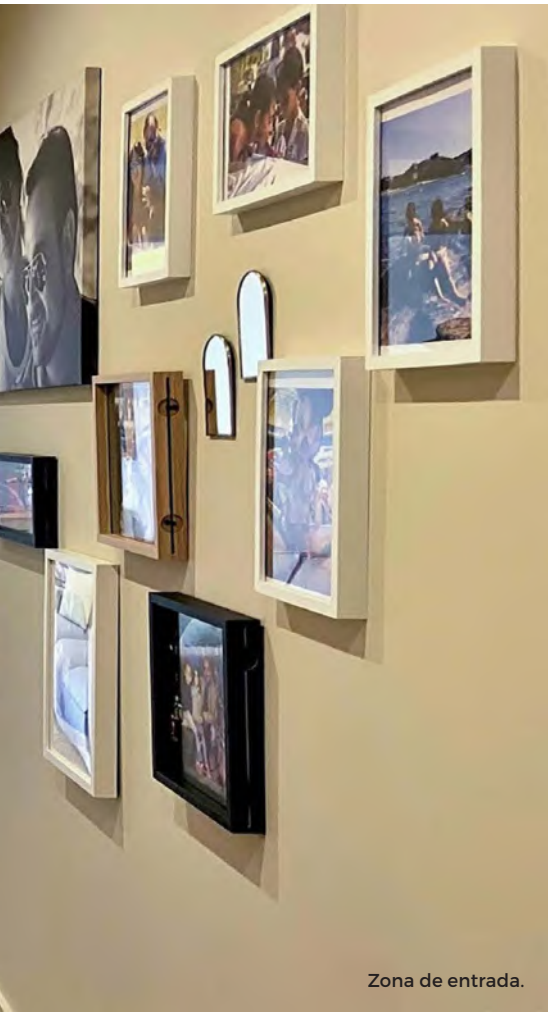
Zona de entrada.

Se optó por pintar las paredes en un tono arena, más acogedor que el blanco y jugar con materiales, tejidos y colores claros, para conseguir un ambiente más cálido.