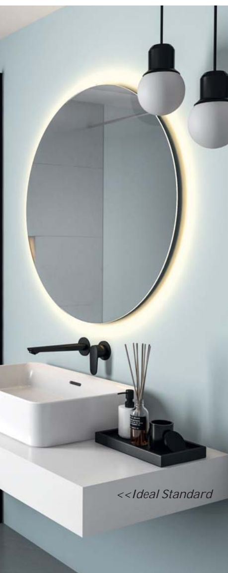
<< Ideal Standard