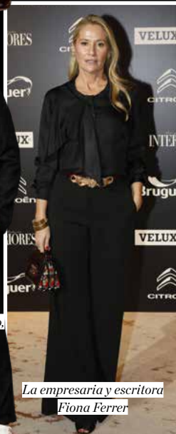
La empresaria y escritora Fiona Ferrer