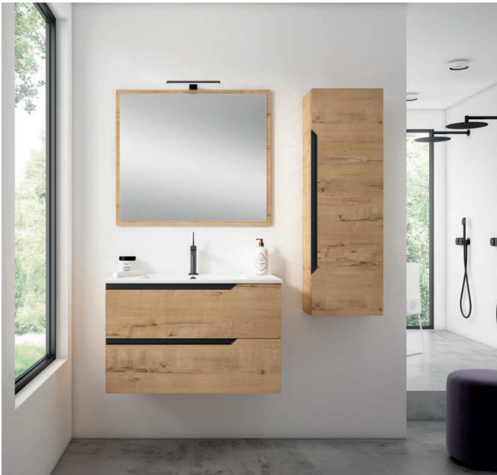
Colección Contract Duo Decosan