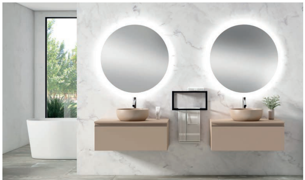
Colección Contract Feel Decosan

La firma ofrece un mobiliario personalizado de alta gama, ergonómico y enfocado a crear una atmósfera única que resuelva las necesidades estéticas y funcionales.