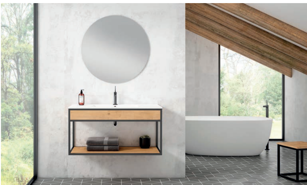
Colección Contract Loftel Decosan acabado estante cristal fumé y acabado estante madera

Las gamas Feel , Loftel y Duo cubren un amplio espectro de estilos, desde minimalistas y elegantes hasta más contemporáneos y audaces. Esta versatilidad les permite abordar proyectos diversos, ya sean hoteles, restaurantes, oficinas u otros espacios comerciales que requieran alta calidad, estilo y durabilidad.