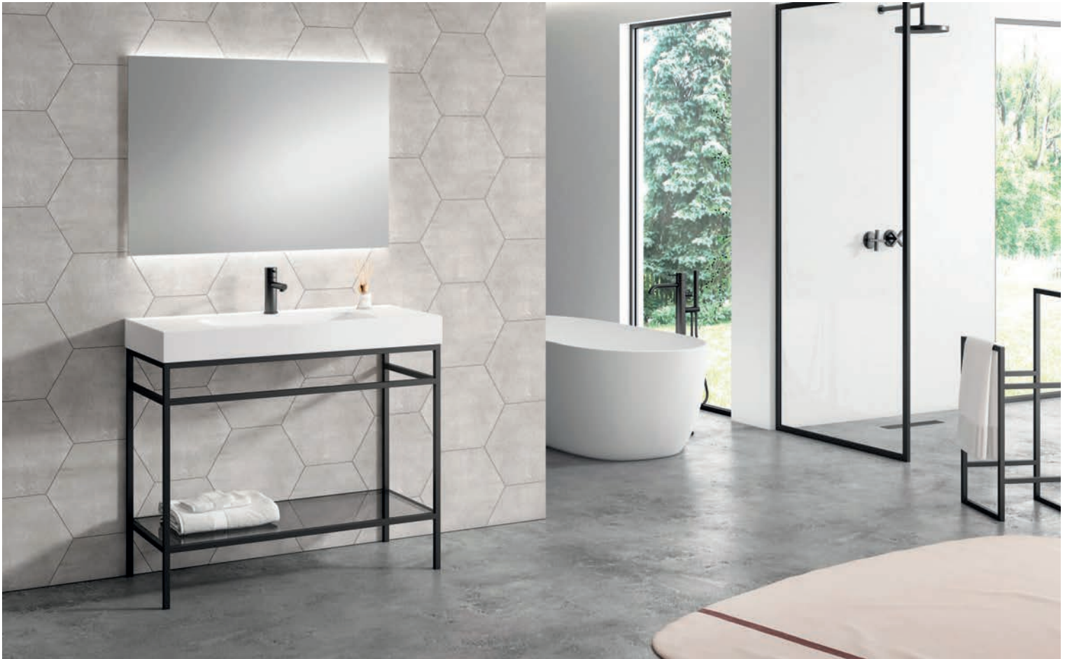
Colección Contract Loftel Decosan

FEEL, LOFTEL Y DUO REPRESENTAN LAS ÚLTIMAS TENDENCIAS Y LA MEJOR CALIDAD PARA DAR VIDA A CADA PROYECTO.