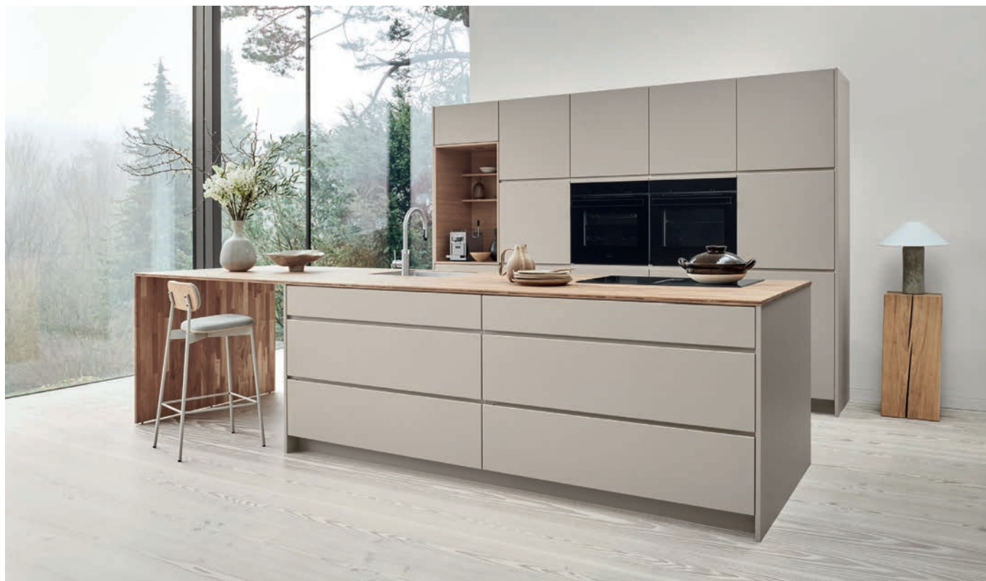
▲ “Arizona Beig” de KVIK. https://www.kvik.es