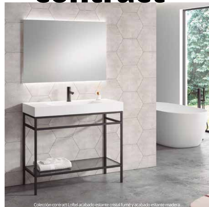
Colección contract Loftel acabado estante cristal fumé y acabado estante madera