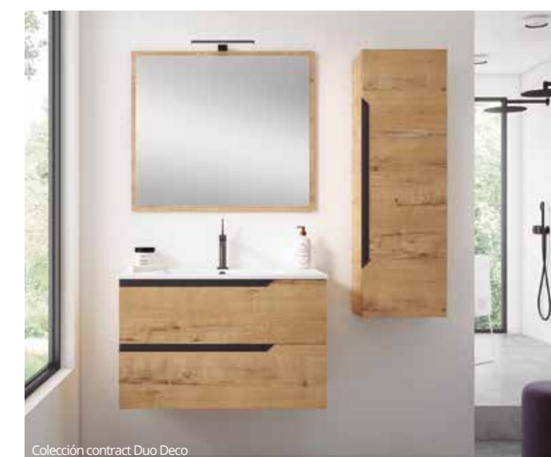
Colección contract Duo Deco

Se distingue por el diseño minimalista y por el tirador asimétrico con acabado metálico que permite que estos muebles se adapten fácilmente a diferentes estilos decorativos. Además de por su estética, la colección destaca por la durabilidad y resistencia de los componentes, que la convierten en una opción ideal para proyectos contract que buscan un equilibrio entre calidad y diseño para soportar el uso diario en entornos exigentes.