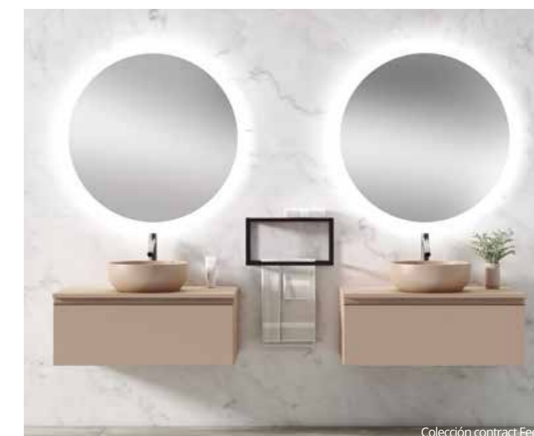
Colección contract Feel

La línea destaca por su estética elegante y sofisticada, diseñada para proporcionar una sensación de lujo, confort y bienestar en el baño. El detalle distintivo es el tirador en forma de inglete con un perfil metálico y acabado satinado que confiere un aspecto suave y refinado que se integra perfectamente con el resto del mueble.